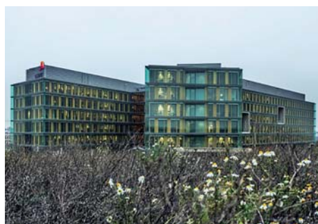
Hoofdzetel PriceWaterhouseCoopers, Gasperich, Luxemburg BREEAM Very Good / Oplevering 2014 ETAP-oplossing met UT1 inbouwarmaturen, R8 en R4 opbouwarmaturen en E6 industriële armaturen.