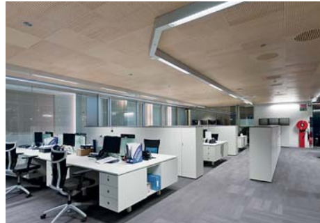
Naturgas Energía, Bilbao, Spanien LEED Platinum / Bauabnahme 2013 ETAP-Lösung mit modularen Kardó-Lichtbändern und D42 LED Downlights