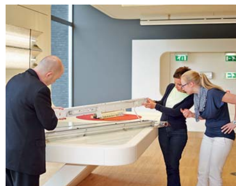
Von der Entwicklung über die Produktion bis zum Kundendienst: Jeder Aspekt der ETAP-Palette wurde unter die Lupe genommen.