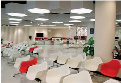
Chamber of Commerce, Dubai, Vereinigte Arabische Emirate LEED Zertifiziert / Bauabnahme 2011 ETAP-Lösung mit Leuchtstoffleuchten nach Maß, D42 LED Downlights und Flare LED Spots

ETAP verfügt über langjährige Erfahrung bei der Zertifizierung von Bauprojekten. Ihr ETAP-Berater hilft Ihnen bei den passenden Lösungen für eine LEED- oder BREEAM-Zertifizierung, den beiden am weitesten verbreiteten System, gerne weiter (*). Unten finden Sie einige Beispiele von Referenzprojekten.