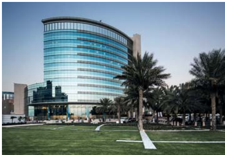
Majid Al Futaim, Dubai, Vereinigte Arabische Emirate LEED Gold / Bauabnahme 2014 ETAP-Lösung mit Flare Spots, D42 Downlights, R7 Pendelleuchten mit Präsenzmeldung und U7 Einbauleuchten (alles LED)